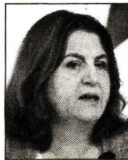
Nunzia Catalfo ministro del Lavoro