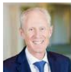
J.C.D. Jean-Christophe Deslarzes Presidente del Consiglio di Amministrazione

Tutti noi contribuiamo in maniera significativa alla cultura dell'integrità e della compliance del Gruppo Adecco. Le nostre decisioni e le nostre azioni quotidiane hanno effetti sull'intera organizzazione e non solo. Attenendoci sempre al nostro Codice di Condotta, possiamo continuare a contribuire positivamente al mondo del lavoro e a far sì che il futuro del lavoro sia migliore per tutti.